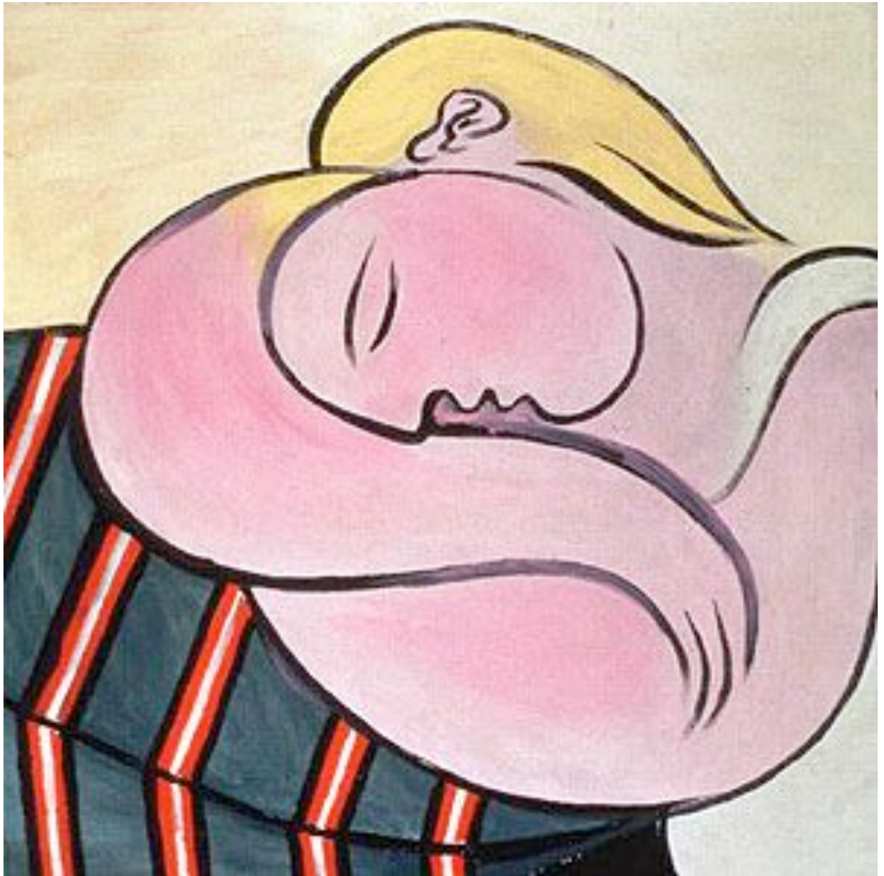
PICASSO "MUJER RUBIA" 1931