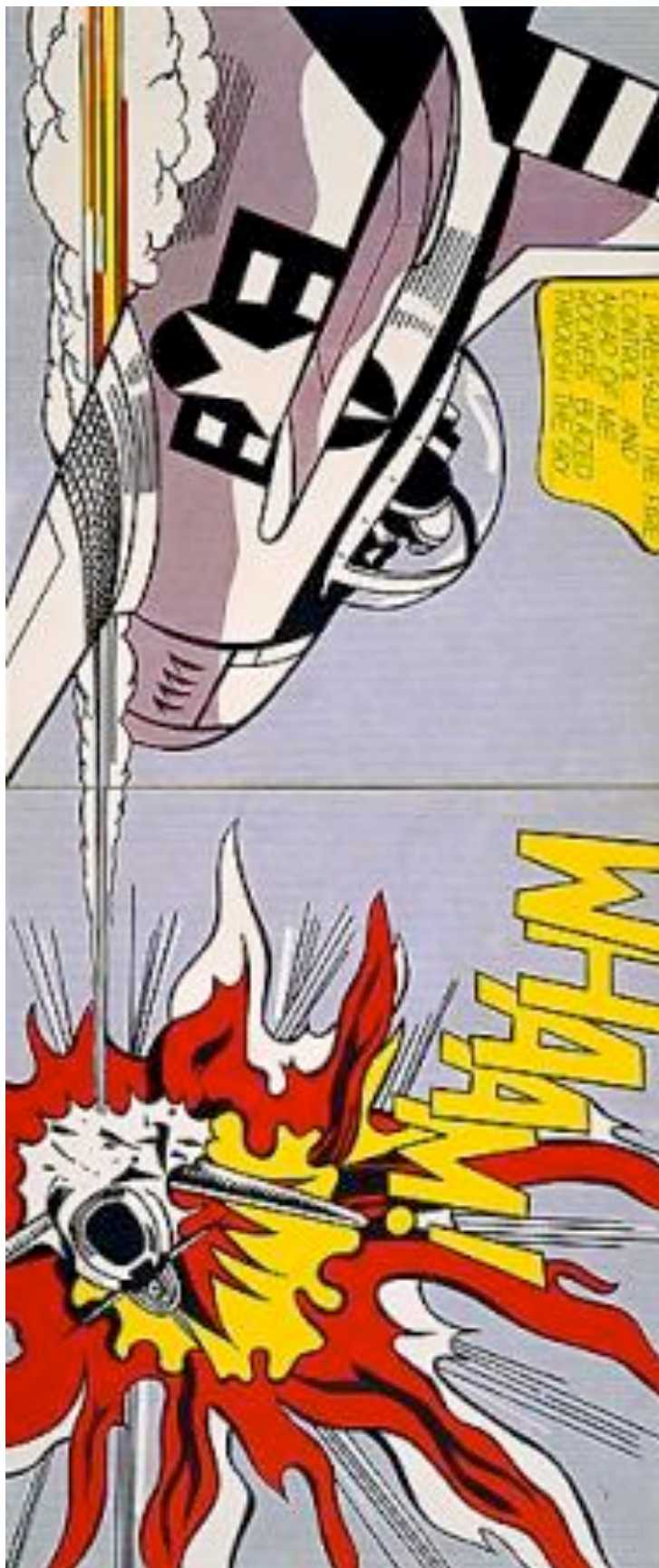
ROY LICHTENSTEIN "Whaam!" (1963)