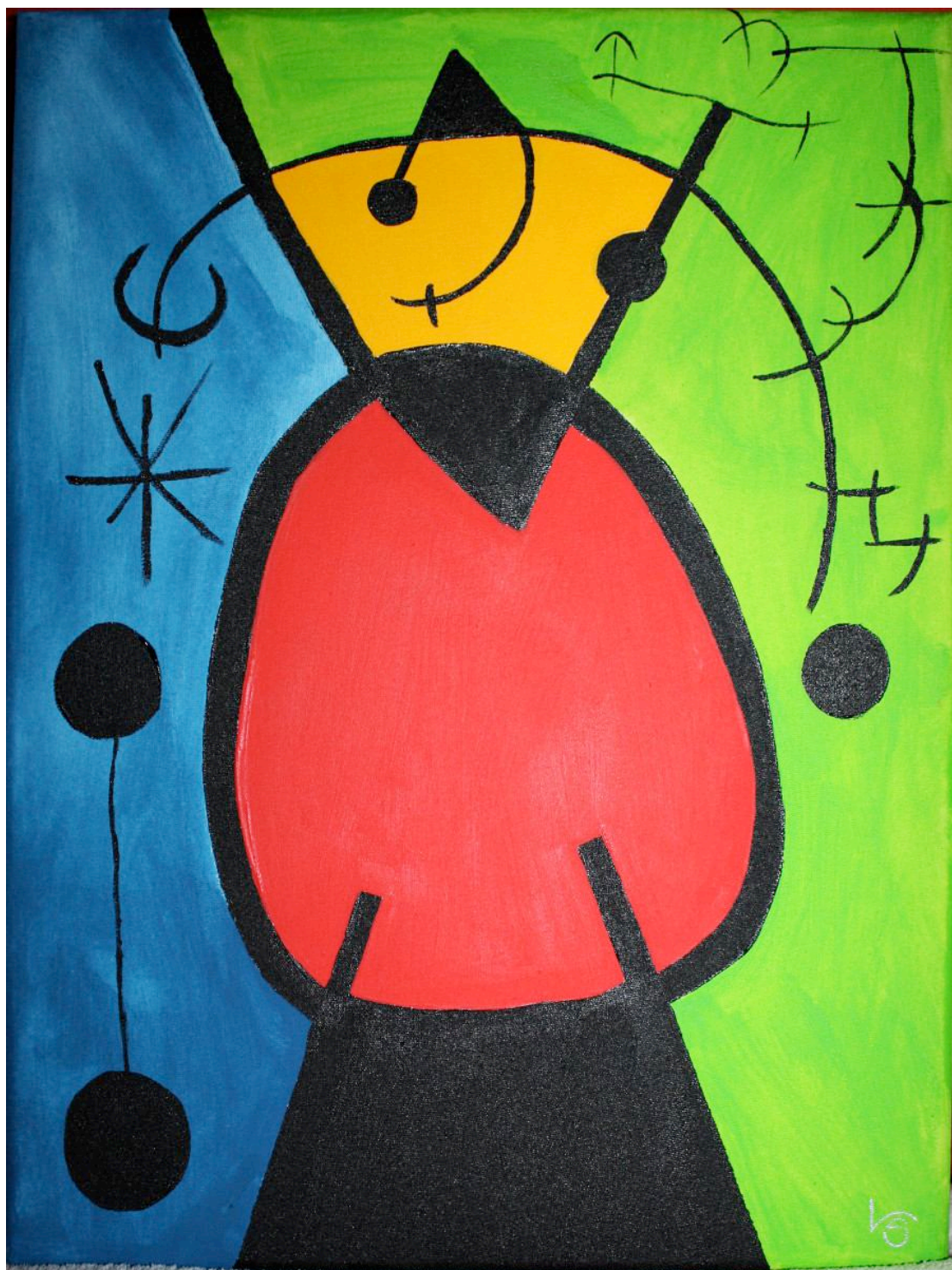
JOAN MIRÓ "AMANECER" 1968