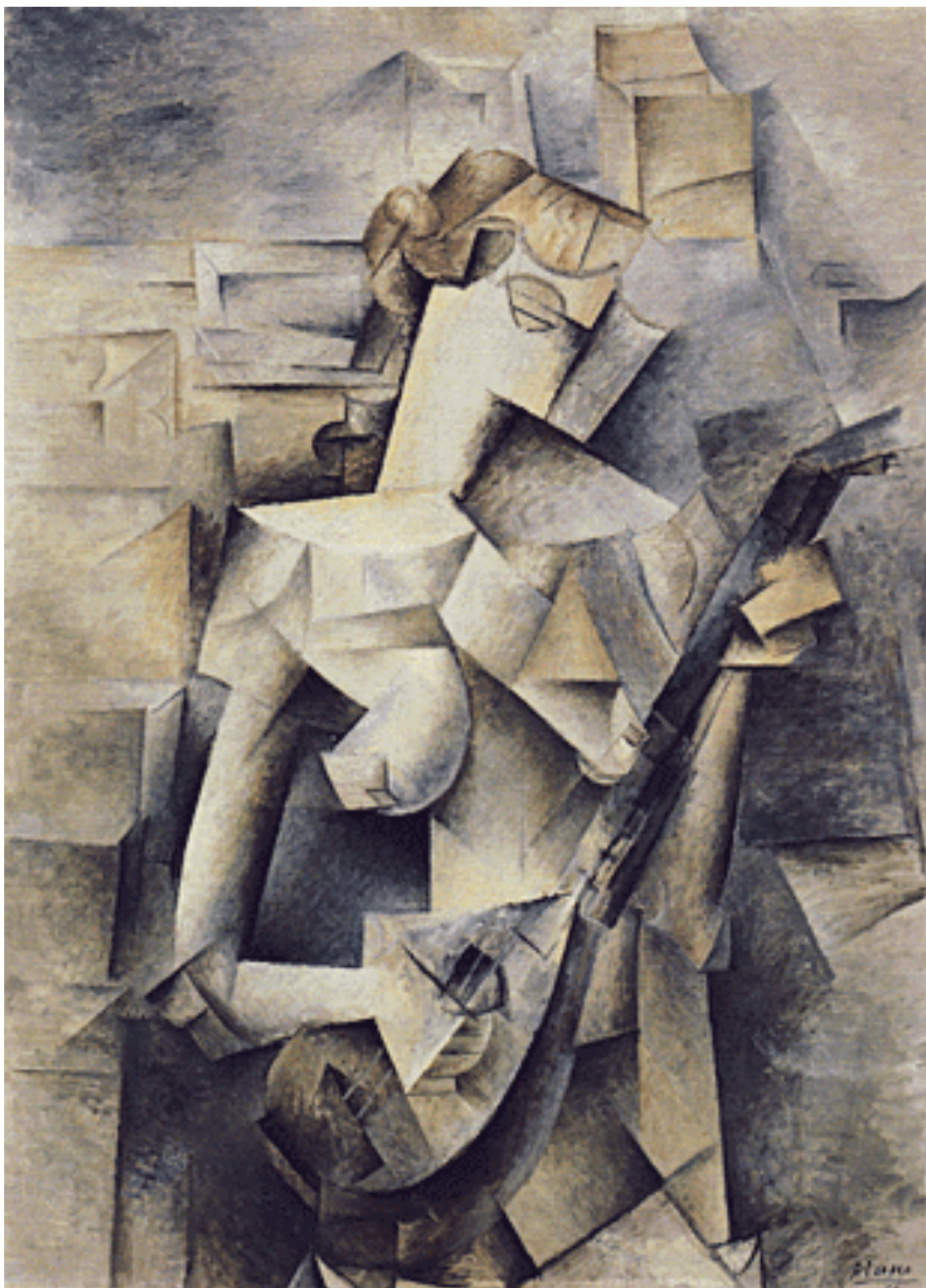
PICASSO "MA JOLIE" 1911