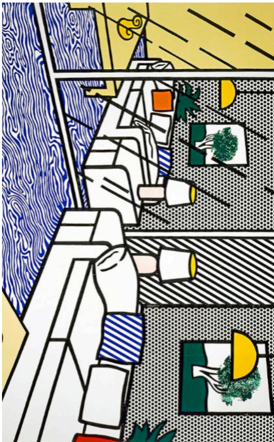
ROY LICHTENSTEIN "WALLPAPER WITH BLUE FLOOR INTERIOR" 1992