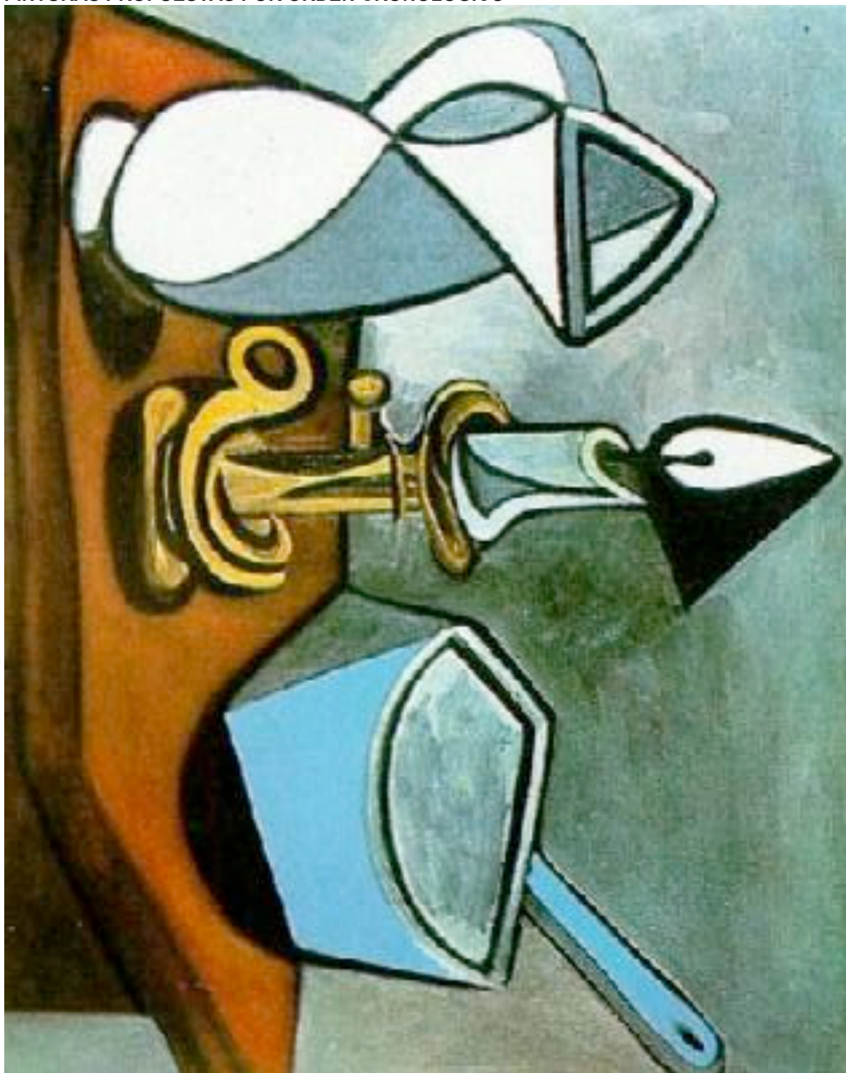
PICASSO " Bodegón" 1901