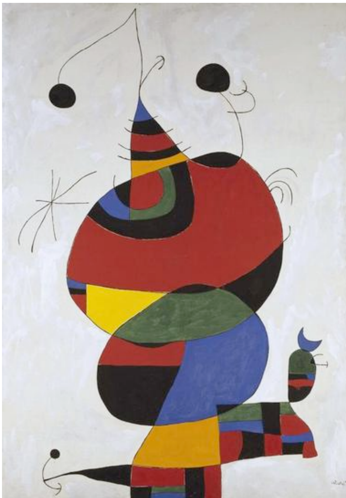
JOAN MIRÓ "MUJER; PÁJARO Y ESTRELLA" 1942